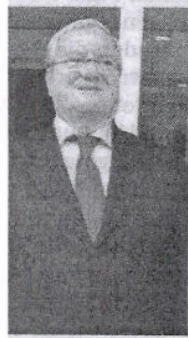
rossi van eg na conflict.

zitter van Tele- o Rossi, is opge- en conflict met de deelhouders van